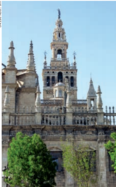
0415e Abb.: sm

Der Innenraum der fünfschiffigen Kathedrale ist ausgestattet mit 20 Seitenkapellen und einem prachtvollen Hauptaltar. Licht fällt durch insgesamt 75 Fenster, die mit hübschen Glasgemälden geschmückt sind.