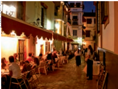
▲ Der Abend bringt Kühle im Barrio de Santa Cruz

von der Plaza Santa Cruz ab), liegen auch einige sehr nette Lokale, außerdem befindet sich dort ein kleines Museum des Malers Murillo, das zuletzt aber wegen Umbauarbeiten längerfristig geschlossen war.