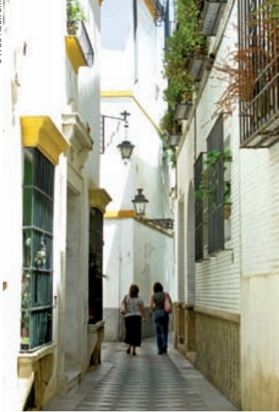
▲ Hier passt kein Auto durch

Ausgehend vom Platz verläuft direkt entlang der Mauer des Real Alcázar das schmale Gässlein Callejón de Agua („Wassergässlein“), dessen Name daran erinnert, dass hier einst ein Aquädukt zum Alcázar führte und so dessen Wasserversorgung sicherstellte. Gerade an dieser Gasse liegen auch einige Häuser mit sehr schönen Patios („Innenhöfen“).