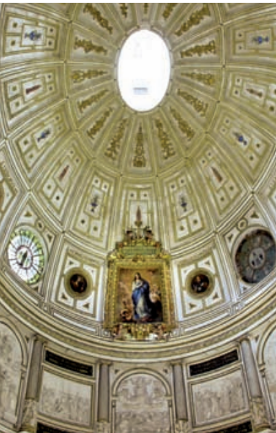
042se

Der Altar wird durch ein Bildnis der Virgen de los Reyes aus dem 13. Jh. geschmückt, der Schutzpatronin von Sevilla. Davor ruhen die sterblichen Überreste von Fernando III. und von Alfonso X., genannt „der Weise“, sowie seiner Frau Beatriz de Suavia. Ebenso fanden Pedro I. und seine Familie hier ihre letzte Ruhestätte.