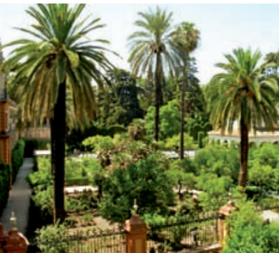
044se Abb.: sm

Geradeaus weiter erreicht man die Palastanlage Palacio Mudéjar von Pedro I., der auch „der Grausame“ genannt wurde. Speziell hier liegen einige sehr schöne Räume, deren kunstvolle Ausgestaltung sich jeder Besucher genauer ansehen sollte. Eine kleine, durchaus gewagte Spitze erlaubten sich die früheren arabischen Baumeister, die übrigens lange Zeit unentdeckt blieb. Sie arbeiteten in das kufische Schriftband (alte