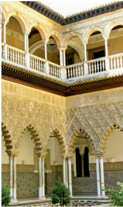
045se