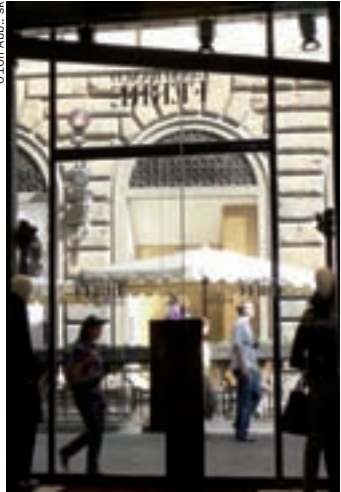
016fi Abb.: sk

Brieftaschen stellt der Familienbetrieb seit über 70 Jahren her, eine kleine Manufaktur wie aus einer anderen Zeit.