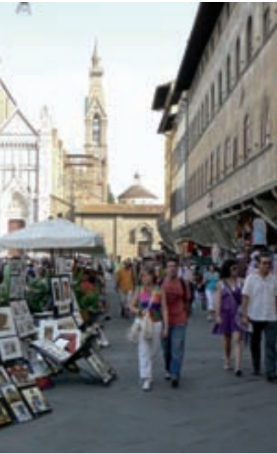
017fi Abb.: sk

sind im Angebot – ein buntes Kontrastprogramm zum grau-beige-schwarzen Einerlei.