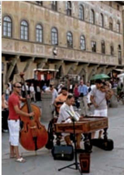
► Straßenmusikanten auf der Piazza Santa Croce