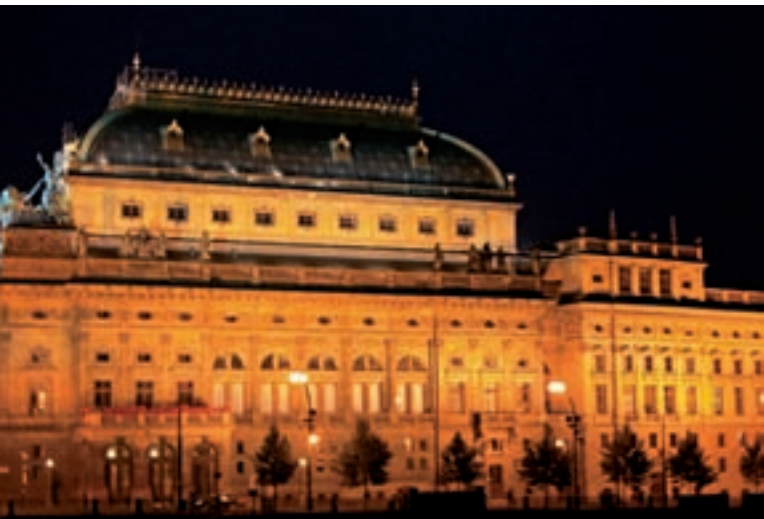
009pr Abb.: gZ