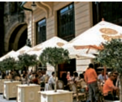
008pr Abb.: gz

Für die Mittagspause eignet sich das beliebte Lokal U Provaznice (s.S.30) am unteren Ende des Wenzelplatzes 25 . Nach Griebenaufstrich und böhmischem Gulasch mit Serviettenknödeln schmeckt das frisch gezapfte dunkle Bier ausgezeichnet. Zurück zum Altstädter Ring 4 und über die mondäne Pariserstraße mit ihren Designer- und Glasgeschäften führt der Weg in die Josefstadt , das jüdische Prag. An der Pforte zur Pinkas-Synagoge 18 erwirbt man das Sammelticket für alle fünf Synagogen, das Jüdische Museum 24 und den Alten Jüdischen Friedhof 19 . Auf engem Raum drängen sich unter mächtigen