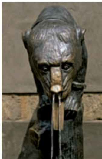
032br