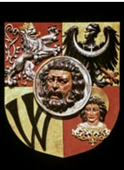
030br Abb.: gs