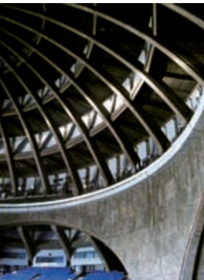
07.1br

Trotz globaler Krise blickt man in Breslau optimistisch in die Zukunft. Die an die neue Autobahn A4 angebundene Stadt profitiert von ihrer grenznahen Lage. Dank Finanzspritzen der EU werden sowohl der Flughafen als auch der Binnenhafen ausgebaut, letzterer ist der größte in Polen. Viel Geld fließt auch in die Kultur: Philharmonie und Musikforum, Oper und Operette, mehrere Theater und hochkarätige Museen stärken das Image, das die Hauptstadt Niederschlesiens mit Grotowskis „Armem Theater“ und Tomaszewskis Pantomimenkunst schon in sozialistischen Zeiten erworben hatte: Breslau – ein Hotspot der Moderne, bastelnd am aufrechten Gang.