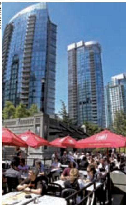
006vc Abb.: tb

Egal, wonach einem nun gerade zumeist ist: Shopping, Nightlife, Kaffeekultur, Wandern, Sightseeing, Menschenmassen oder einsame Natur – Vancouver bietet für jeden etwas. Und zwar immer zum Greifen nah – egal, wo man sich gerade befindet.