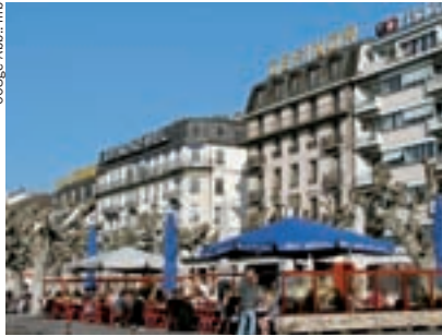
▲ Einladende Freiluftcafés an der Seepromade