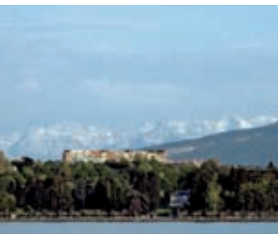
0.11ge Abb.: mb