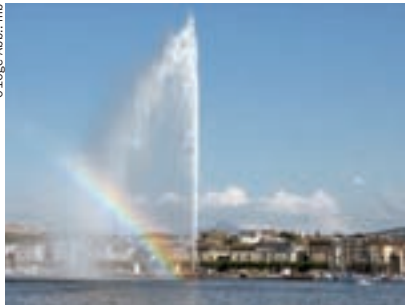
▲ Wahrzeichen Genfs: der Jet d'eau