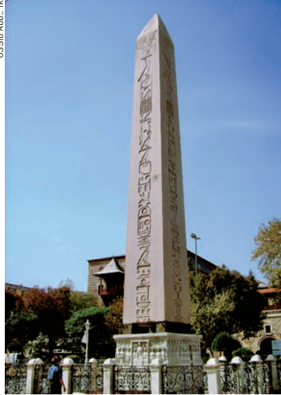
0331b Abb.: fk

Ein paar Meter weiter steht in einer Vertiefung der Burma Sütun (von den Einheimischen meist als „Yılandaş“ – Schlangensäule – bezeichnet). Die einst 8 m hohe Bronzesäule (heute nur noch 6 m hoch) war ein Dankgeschenk von 31 Griechenstädten an den Apollon-Tempel zu Delphi für den gegen die Perser errungenen Sieg bei Plataiai (479 v. Chr.). Die