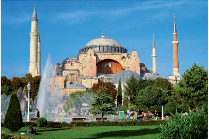
0301b Abb.: ftk

7000 m 2 umfassenden Grundfläche eine buchstäblich gewaltige Herausforderung für die größten Baumeister der Sultane, die das christlich-imperiale Vorbild in Folge zu übertreffen suchten.