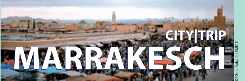
069 ma Abb.: fo/SMICE