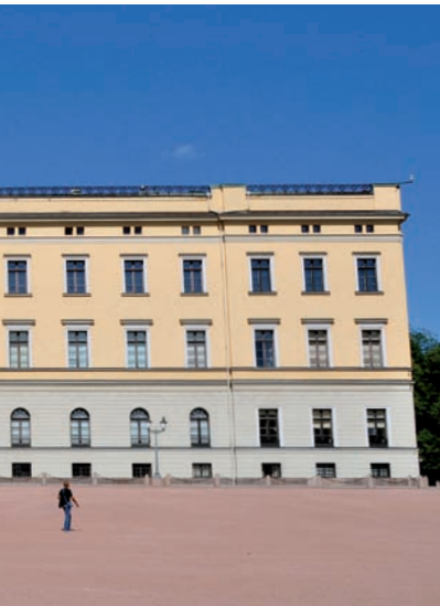
02400 Abb.: ms

Ist das Schloss nicht zugänglich, kann immerhin noch der idyllische Schlosspark besichtigt werden. Bei einem Rundgang trifft man dabei auch die königliche Garde , deren sehenswerte Wachablösung täglich um 13.30 Uhr stattfindet. Sollte im Übrigen eines der royalen Familienmitglieder anwesend sein, so erkennt man das daran, dass die königliche Flagge , ein goldener Löwe mit Axt auf rotem Grund, gehisst ist.