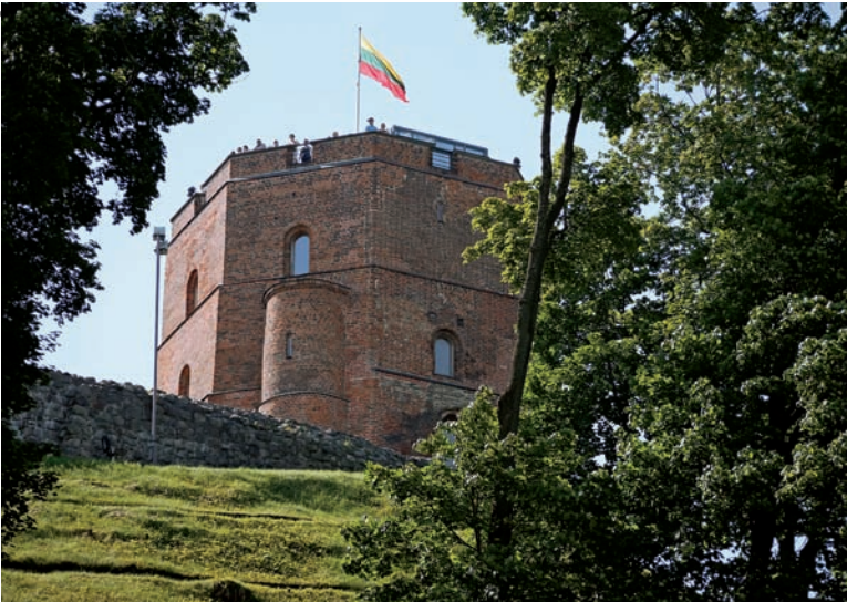
02.7vi Abb.: 65

bald aber soll der neue Palast als Museum fungieren. Das Litauische Nationalmuseum wird hier Überreste der alten Burg zeigen, archäologische Funde aus der Frühzeit der Stadt. Daneben soll es Dauer- und