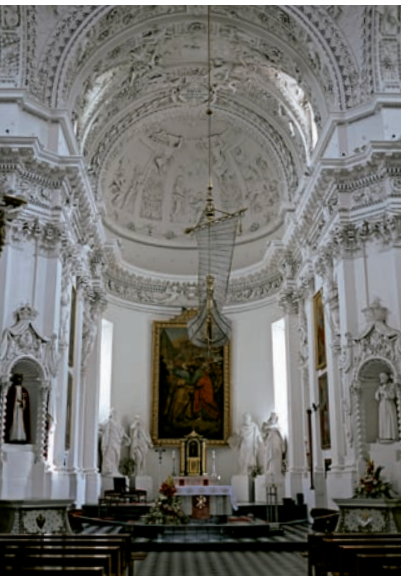
028v Abb.: gs

Der weithin sichtbare Lüster in Form eines Schiffes wurde erst vor gut einhundert Jahren geschaffen. Am Altar am linken Ende des Querschiffes findet sich das Bild der „Gnadenreichen Jungfrau Maria“, auf dem die Muttergottes die Blitze des Gotteszornes zerbricht. Es ist ein Gnadenbild ,