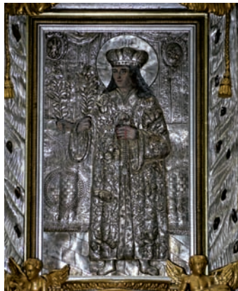
026VI Abb.: 65

Prunkstück der Kathedrale und am meisten besucht ist die Kasimirkapelle . Bau und Ausstattung stammen von italienischen Architekten, Bildhauern und Freskenmalern, welche in der zweiten Hälfte des 17. Jahrhunderts die von den Russen zuvor verwüstete Grabstätte des heiligen Kasimir neu schmückten. Heute krönt die Kapelle eine mit rotem und schwarzem Marmor ausgekleidete Kuppel aus schwedischem Sandstein. In den Nischen stehen versilberte Herrscherfiguren. Große bunte Fresken an den Wänden erzählen aus dem Leben des Heiligen und geben Kunde von Wundern wie der Öffnung seines Sarges, in dem Kasimirs Körper auch nach mehr als hundert Jahren nicht verwest war. Heute liegt sein Leichnam in einem Silbersarg. Den Altar der Kapelle ziert ein mit Silber ausgeschlagenes Bild des Heiligen aus dem 16. Jahrhundert. Es zeigt Kasimir mit gleich drei Händen . Der Legende nach kam die dritte Hand bei der Restauration des Bildes Ende des 17. Jahrhunderts trotz mehrmaligen Übermalens immer wieder unter der Farbe zum Vorschein, sodass der Restaurator damals überzeugt war, es mit einem Wunder zu