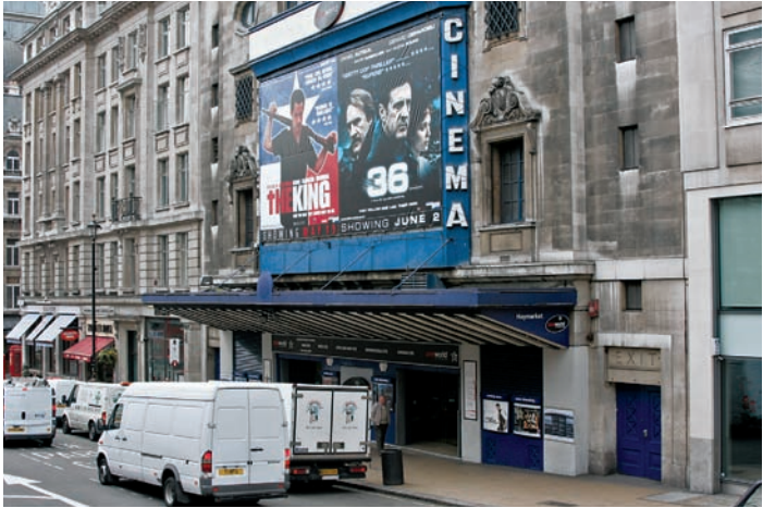
025in Abb.: hs