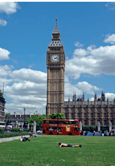
033 In Abb.: ws

Im Oktober 1834 brannten die Parlamentsgebäude bis auf die Grundmauern nieder. Ein Wettbewerb zur Neugestaltung der Houses of Parliament wurde ausgeschrieben und der Architekt Charles Barry erhielt mit seinem neogotischen Entwurf den Zuschlag. 1840 begannen die 20 Jahre dauernden Bauarbeiten, 1847 konnten die Lords ins Oberhaus einziehen, 1852 hatten dann auch die Commons ihren Sitzungssaal. Den Uhrenturm Big Ben stellte man 1858 fertig. Weltberühmt und eines der Wahrzeichen Londons, ist er nach der größten Glocke benannt, die in ihm hängt. Das nicht minder berühmte Glockenspiel, das die Uhrzeit anzeigt und auch den Sendungen der BBC vorangestellt ist, gibt eine Klangfolge aus Händels „Messias“ wieder. Übrigens: Wer nach Einbruch der Dunkelheit Big Ben passiert, sollte einen