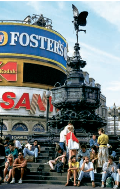
026in Abb.: hs