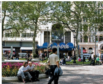
029in Abb.: hns

Nur einen Steinwurf vom Leicester Square entfernt und erreichbar über die Cranbourn Street liegt Covent Garden. Hier befindet sich Londons berühmtes Opernhaus und noch bis vor wenigen Jahren wurde hier der nicht minder berühmte Gemüsemarkt abgehalten. Die Bezeichnung Covent Garden geht auf „Convent Garden“ zurück. Das Areal gehörte einst zur Westminster Abbey und die Mönche nutzten das Gelände