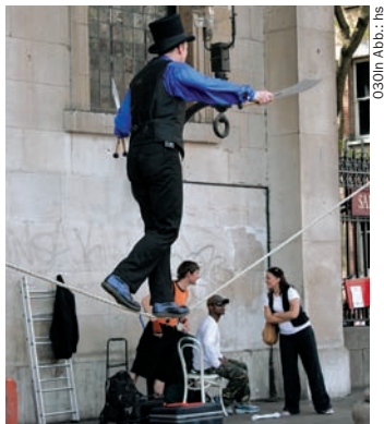
030In

📍124 [K11] Lamb and Flag , 33 Rose Street, off Garrick Street, U-Bahn Covent Garden. 300 Jahre alter Pub, früherer Name „The Bucket of Blood“, da verbotene Boxkämpfe im oberen Stock stattfanden. Der Literat John Dryden schrieb hier Schmahgedichte gegen die französische Mätresse von Karl II.