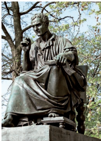
04.3ge Abb.: mb