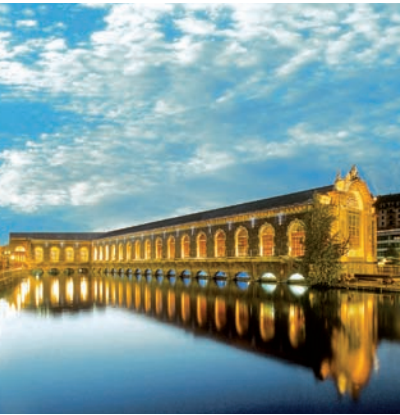
041.gg Abb.: gt

E-Werk und heute als Kulturzentrum mitten in der Rhône mit einem fast 1000 Plätze fassenden Konzertsaal. Théodore Turrettini plante dieses faszinierende Bauwerk, das zwischen 1883 und 1892 errichtet wurde.