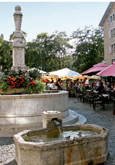
046ge Abb.: mb

Die Passage des Degrés-de-Poules (Hühnerleiter), eine kuriose durch