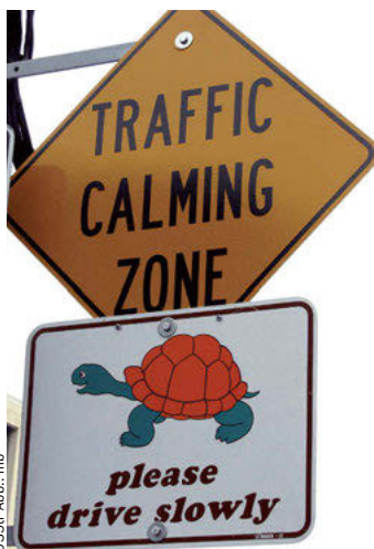
035tr Abb.: mb

ßen und Linksabbiege-Verbote. In der Rush Hour (7–9 und 16–18 Uhr) geht es höllisch zu und Staus sind an der Tagesordnung.