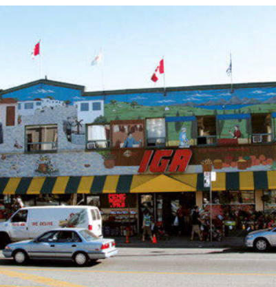
038tr Abb.: mb