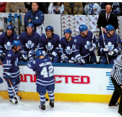
019tr Abb.: mb

Die bis zu 21.000 Zuschauer (18.819 bei Eishockey, 19.800 bei Basketball) fassende Mehrzweckhalle wurde 1999 direkt südlich der Union Station 9 gebaut. Sie löste damit funktional die legendäre, aber in die Jahre gekommene Eishalle im Zentrum, Maple Leaf Gardens (s. S. 70), ab. Abgesehen von Konzerten ist das ACC in erster Linie Heimat der