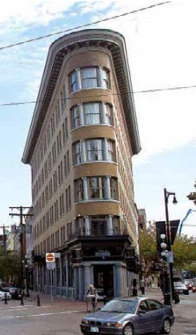
◀ Blick vom Maple Tree Square auf das historische Gastown