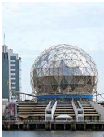
025vc Abb.: tb