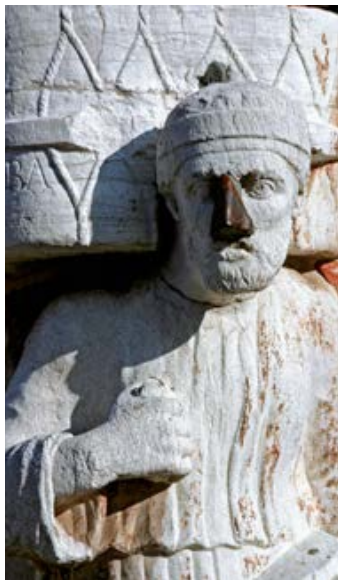
034ve

„Mohr“, der in einer Nische hinter einer Ecke von Tintoretto's Haus steht, soll der treue Diener der Familie Mastelli sein.