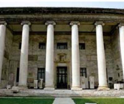
034 ve Abb.: sk