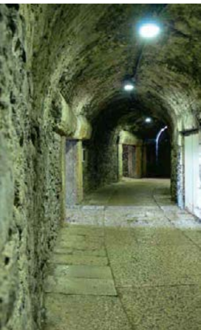
031ve

führungen in der Arena. Die ausgezeichnete Akustik machte und macht es möglich, 22.000 Menschen, die auf den Stufen des Inneren Platz fanden, auch ohne moderne Technik an den Kunstgenüssen teilhaben zu lassen. Mit der ersten Aufführung der Neuzeit 1913 – Verdis Aida – waren die Opernfestspiele begründet.