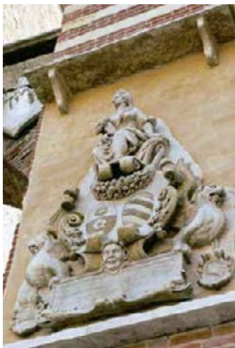
037 ve Abb.: sk