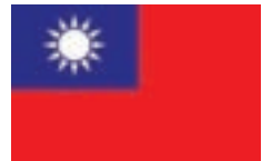
Die Staatsflagge: Blau für Demokratie, Weiß für Wohlstand und Rot für Nationalismus

Mit Ma YingJius Amtsantritt als Präsident ist das Zeitalter des Kalten Krieges zwischen beiden Seiten vorerst beendet, und im Ergebnis wurden am 15.12.2008 tägliche Direktflüge zwischen China (u.a. ShenZhen, ShangHai) und Taiwan aufgenommen. Ma YingJiu meinte dazu, „Von nun an wird der Dialog an die Stelle der Konfrontation treten.“