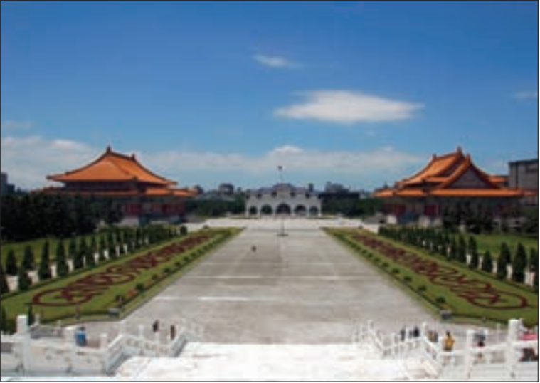
Das Mausoleum ChiangKaiSheks