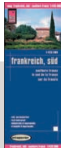
Landkarte Frankreich, Süd 1:425.000: Für den Durchblick im Reiseland

Mit REISE Know-How gut vorbereitet in die Auvergne: