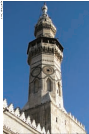
Eines der Minarette der Umayyaden-Moschee

Als Tourist geht man links am Gebäude entlang. Am Ende der Umfassungsmauern sind rechts in der ersten Gasse auf der linken Seite der Ticket-schalter und Umkleideraum. Hier zahlt man ein geringes Eintrittsgeld und frau erhält ein mantelartiges Gewand mit Kapuze (Eintritt 50 Lira). Man folgt weiter den Moscheemauern und erreicht nach ca. 100 m einen offenen Platz. Das Saladin-Mausoleum befindet sich nun links, zur Moschee geht es noch ein Stück weiter geradeaus. Wir beginnen die Besichtigungstour mit dem Saladin-Mausoleum (1) , einem Kuppelbau aus dem 12. Jahrhundert, der zwei Sarkophage enthält. In dem linken Sarg liegen die sterblichen