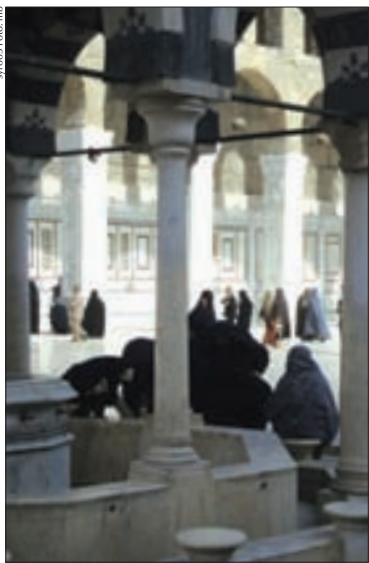
Umayyaden-Moschee: Verschnaufpause am Innenhof-Brunnen