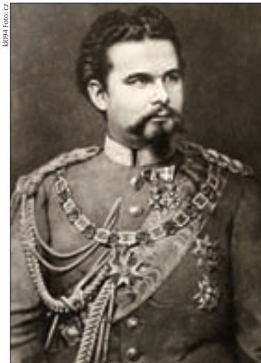
Ludwig II. als Kriegsherr

König Ludwig II. gründet in München eine als Hochschule reorganisierte „Polytechnische Schule“ mit Hochschulstatus, die ab 1877 den Titel „ Technische Hochschule “ führt. Das ursprüngliche Gebäude wurde im Zweiten Weltkrieg schwer beschädigt und nach dem Krieg abgetragen. Die Hochschule an sich existiert noch heute und zählt weltweit zu den ältesten technischen Hochschulen.