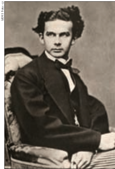
Der junge König auf einem Fotoporträt aus dem Jahr 1867

König Maximilian verstirbt kurz vor Mitternacht, die Todesursache ist bis heute unklar. Es könnte sich um eine Blutvergiftung gehandelt haben, da sich Maximilian einige Tage vor seinem Tod beim Ankleiden mit einer Nadel gestochen hatte. Er wird in einer Seitenkapelle der Münchner Theatinerkirche St. Kajetan beigesetzt. Bei Maximilians Beerdigung reckt ganz München die Köpfe hoch, um den neuen König zu sehen, der nach zeitgenössischen Berichten wie ein junger Gott dem Sarg hinterher schritt. Schon körperlich ist der König herausragend – während damals die Durchschnittsgröße 165 cm betrug, ragt er stolze 193 cm in die Höhe. Der Komponist Richard Wagner sagt ihm, nachdem er ein Bild des Königs in einem Münchner Schau­fenster gesehen hatte, „unsägliche An-