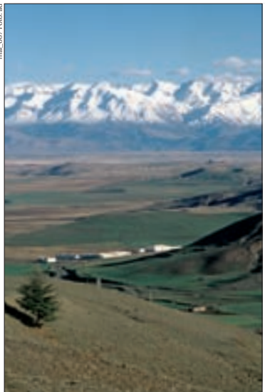
Schneebedeckt – der Hohe Atlas