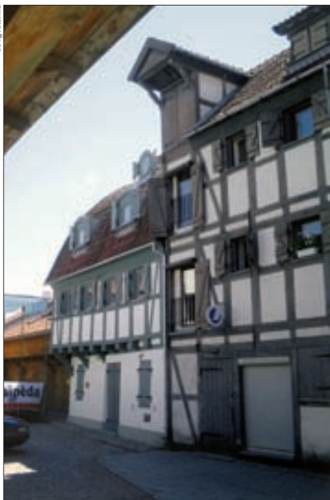
► Fachwerkhäuser in der Altstadt