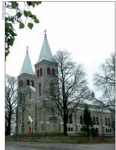
Die Maria-Magdalena-Kirche in Rapla