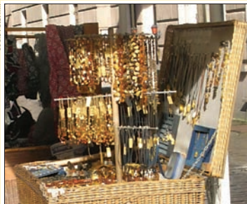
Straßenverkauf des „baltischen Goldes“