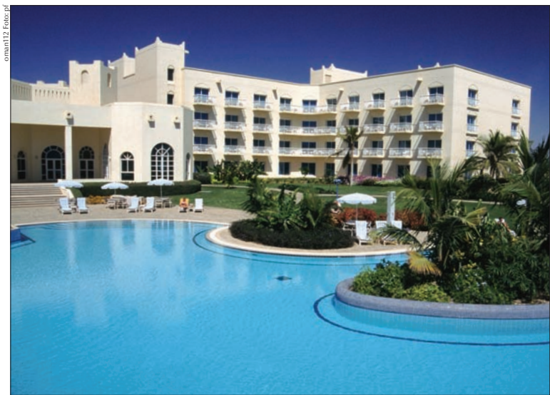
oman112 Foto: of

Preiswerte arabische Gerichte in der 23rd July Street, 7–24 Uhr