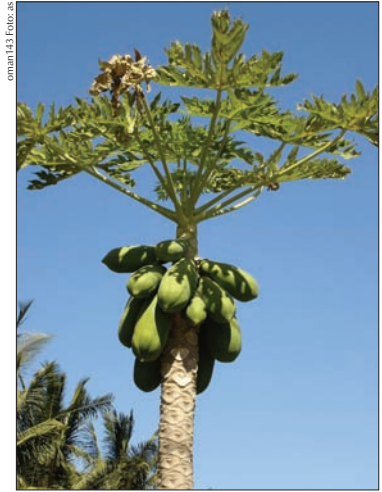
omant 143

In erster Linie ist Salalah eine moderne Stadt . Neue Betonbauten bestimmen das Bild im Zentrum, wo alle wichtigen Infrastruktureinrichtungen in den letzten zwei Jahrzehnten entstanden sind. Traditionelle Kalksteinhäuser findet man fast nur noch im Stadtteil Al-Hafah, doch auch dort werden sie immer seltener.