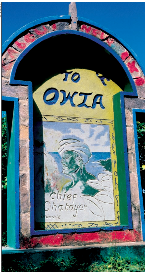
St. Vincent, Grenadinen