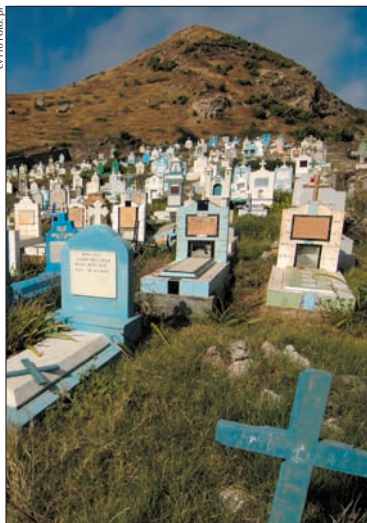
Friedhof in Nossa Senhora do Monte