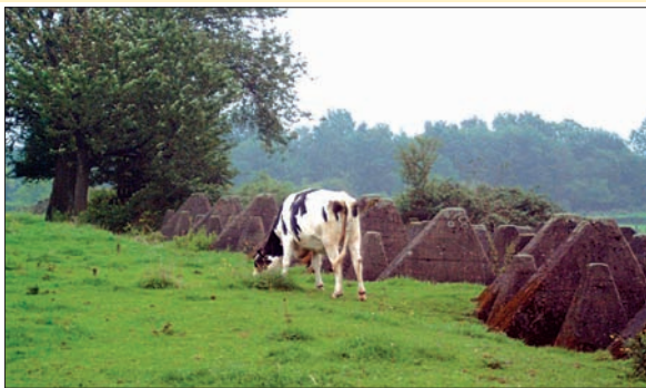
Sichtbare Überreste des Westwalls: die Panzersperren