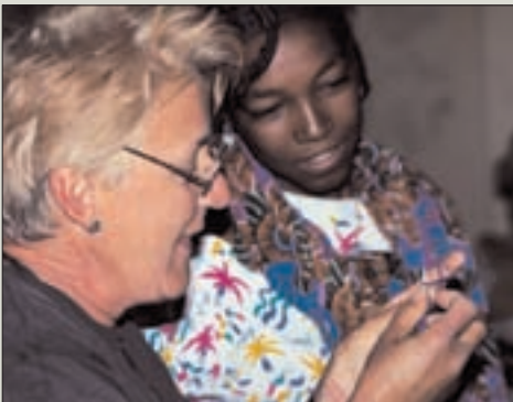
007 rr

Freilich birgt auch diese Reiseform gewisse Risiken. So wird bei der ungleichen Begegnung zwischen den finanzstarken Besuchern und den relativ armen Besuchten oft die Erwartung des großen Devisensegens genährt. Auch neigen solche Projekte dazu, ihr Engagement von der eigentlichen Entwicklungsarbeit hin zum „schnellen Geld“ durch Tourismus zu verschieben. Dennoch überwiegen die positiven Aspekte dieser Reiseform: Das Interesse der Besucher am Projekt fördert das Selbstwertgefühl der Projektmitglieder und trägt zu gegenseitigem Verständnis bei. Somit kann Projekttourismus auf verträgliche Weise die Sehnsucht von Touristen nach neuen Erfahrungen befriedigen und gleichzeitig Hilfsprojekte unterstützen. Dadurch ist Projekttourismus ein wichtiger Impulsgeber für die kritische Weiterentwicklung des Massentourismus.