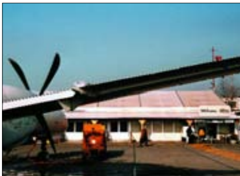
011 fh Abb.: rk

► Gegenüber einem Großflughafen wirkt der kleine Berner Airport fast idyllisch