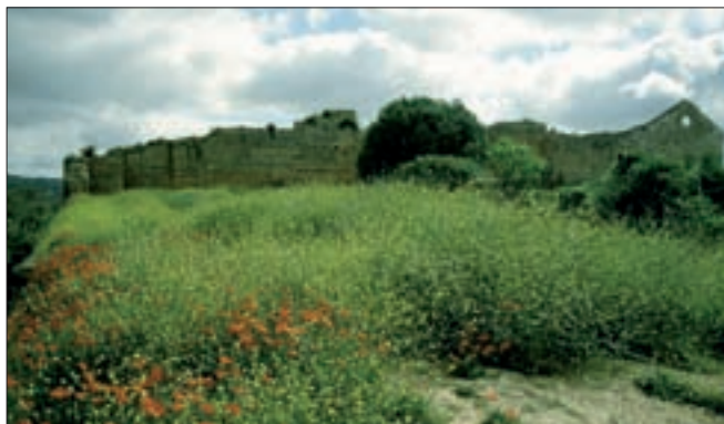
▲ Die Ruine von Paderne – ein beliebtes Kurzwanderziel

Das Schwierigste an der Wanderung ist das Finden des Ausgangspunktes .