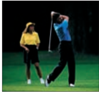
045al Abb.: vm