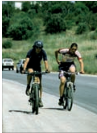
041al Abb.: wj

▲ Selten gibt es einen befahrbaren Randstreifen wie hier