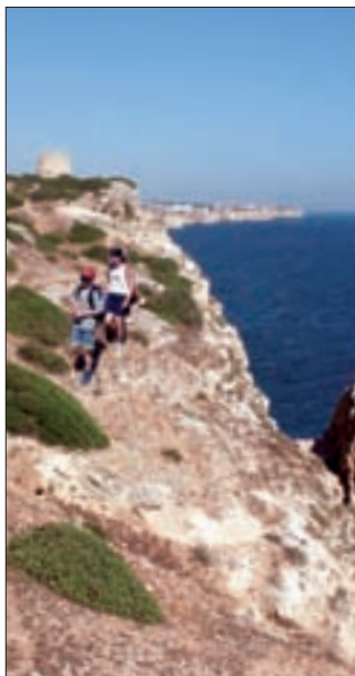
03.5al Abb.: kw

● Abstecher 2, Torre de Aspa-Tour: In Vila do Bispo am Kreisel nach rechts statt geradeaus zu den Menhiren. Am zweiten Kreisel dem beschilderten Sträßchen Richtung Castelejo-Strand folgend, liegt nach 2,5 km rechter Hand ein kleiner Rastplatz mit Holzlandkarte. Gegenüber (links ab Sträßchen)