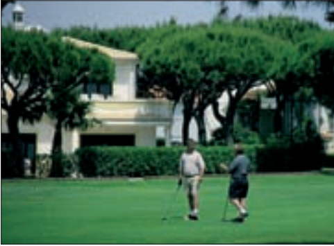
◀ Nobelresort Vale de Lobo