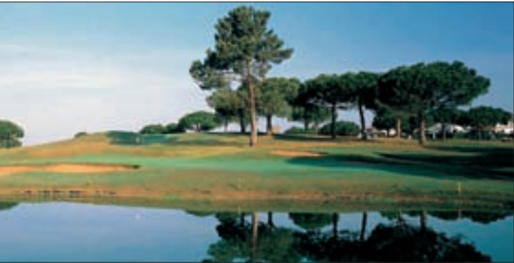
044a1 Abb.: vm