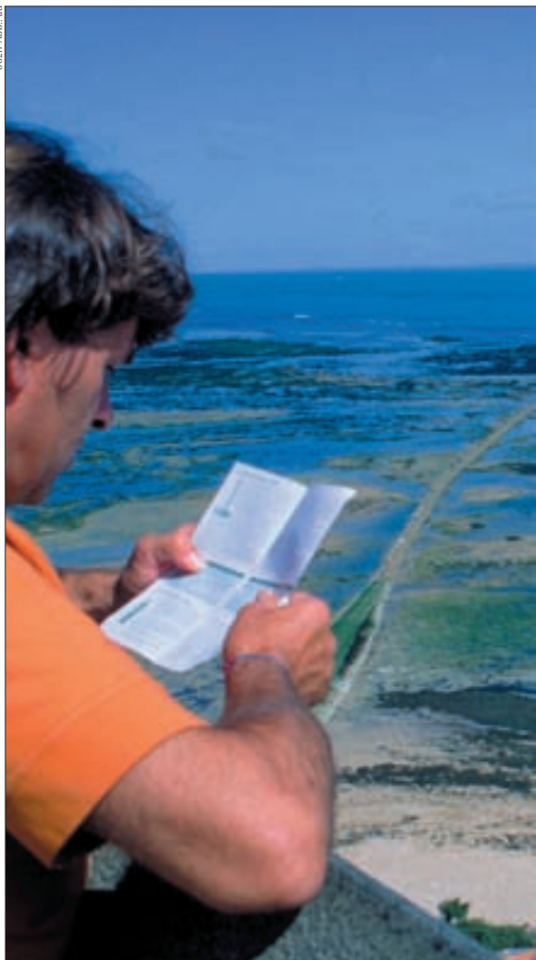
► Küstenaussicht vom Phare des Baleines, Île de Ré