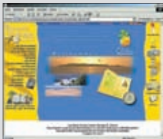
014g.c Abb.: 18