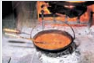
022NH Abb.: st

Fische kommen gegrillt und geschmort auf den Tisch, Meeresfrüchte in vielfältigen Variationen. Da gibt es Tonno al piedo, am Spiess gebratenen Tunfisch, Filetti di sogliola al pomodoro, Seezungenfilets in Tomatensoße, Merluzzo alla marchigiana, frittiertes Kabeljau oder Triglie alla siciliana, Rotbarben auf sizilianische Art. Süßwasserfische kommen als Trota al cartoccio, in Folie mit Gemüse gegarte Forelle oder etwa als Anguila in umido, Aal in Tomatensauce auf den Tisch. Und wer kennt nicht Calamari fritti, die im Teigmantel ausgebackenen Tintenfische, Gamba alla veneziana, die venezianischen Garnelen oder Cozze ripiene, gefüllte Muscheln, auch als Cozze vino bianco, Muscheln im Weißweinsud.