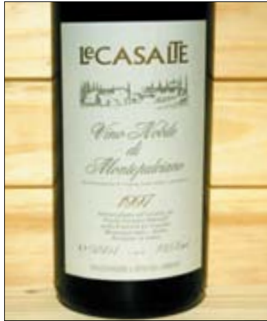
► Vino Nobile di Montepulciano – ein DOCG -Wein

exakte Kontrolle der Mengenbegrenzung bei der Erzeugung. Die ersten vier DOCG -Auszeichnungen erhielten Barbaresco, Barolo, Brunelli di Montalcino und Vino Nobile di Montepulciano . Im Laufe der Zeit sind eine Reihe weiterer hinzugekommen, wie etwa Vernaccia di San Gimignano, Franciacorta, Brachetto d'Acqui, Gavi oder auch Soave recioto und Soave superiore.