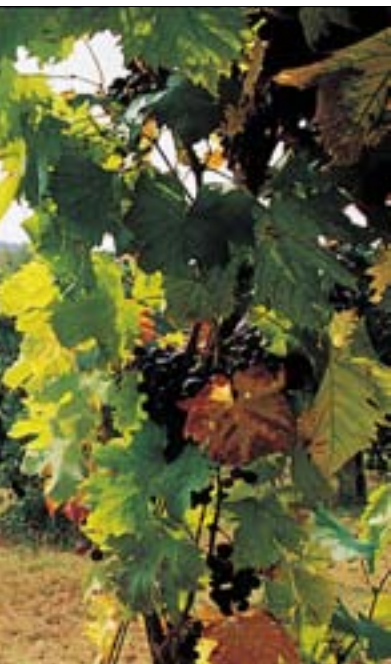
◀ Weinberge vor Rocca Dozza in der Emilia Romagna

Die subalpine Zone Italiens ist wettermäßig begünstigt, wird sie doch durch die hohen Alpengipfel vor der Unbill atlantischer Störungsausläufer geschützt. Durch warme Südwinde begünstigt, kann sich so der Weinbau in den Alpentälern bis auf 1000 Meter Höhe ausbreiten. Die nächtliche Abkühlung fördert gerade die Aromabildung weißer Trauben, die hier aromatische, fruchtbetonte Weine ergeben. Späte Fröste könne zwar noch Schaden anrichten, aber das Problem lässt sich beispielsweise durch Besprühung lösen – so wird Eis erzeugt, denn beim Übergang von Wasser zu Eis wird Wärme freigesetzt, was die Reben vor dem Frost schützt. An anderer Stelle