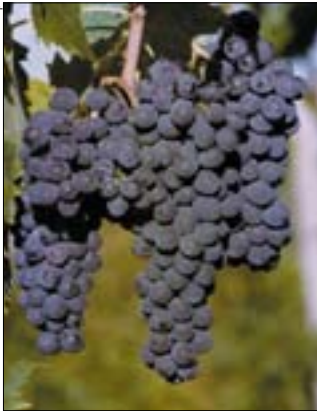
012wei Abb.: fb