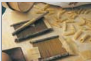
021/wf Abb.: sf

Als Primo Piatto, dem ersten Hauptgericht , werden vor allem Teigwaren in allen Variationen gereicht: die langen, dünnen Spaghetti, die Maccharoni mit Hohlraum, die an den Seiten quer geschnittenen Penne, die schmetterlingsartigen Farfalle und nicht zuletzt die Bandnudeln Tagliatelle. Zu den gefüllten Teigwaren zählen Cannelloni, gefüllte Teigrollen, die Lasagne aus Teigplatten mit Füllung wie auch die kleinen gefüllten Teigtaschen Ravioli oder die gefüllten Teigringe Tortellini. Als erstes Gericht kommen auch Reisgerichte in Betracht, wie etwa Risotto alla milanese.