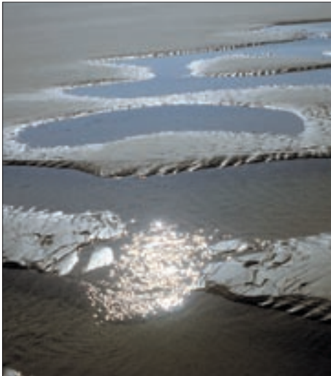
► Das Watt – flach und ohne Ecken und Kanten

zerbröselte die Festlandküste unter dem Ansturm der steigenden Nordsee und die Brücke nach Helgoland zerbrach. Dieserart entstanden die Nordfriesischen Inseln , Überreste des alten Festlandes, während die einer ↗Marschenküste vorgelagerten ostfriesischen Schwestern Sandkorn für Sandkorn aus der Nordsee emporgespült wurden, zunächst schütterere Bänke bildeten und erst um die Zeitenwende insulare Gestalt annahmen. Und jetzt begann auch das Zeitalter der Wattenbildung.