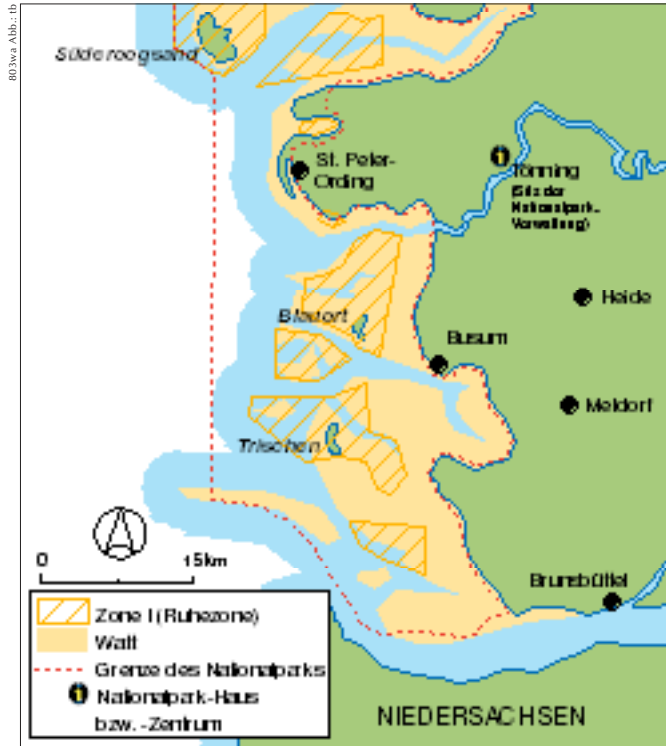
▲ Nationalpark Schleswig-Holsteinisches Wattenmeer

reich der Ruhezone existieren nur wenige Begehungsmöglichkeiten. Lediglich in Ausnahmefällen (z.B. zwischen dem Festland und Langeoog/Spielerooog oder im Watt bei Dangast) darf eine Route durch diese Zone benutzt (aber nicht von ihr abgewichen) werden.