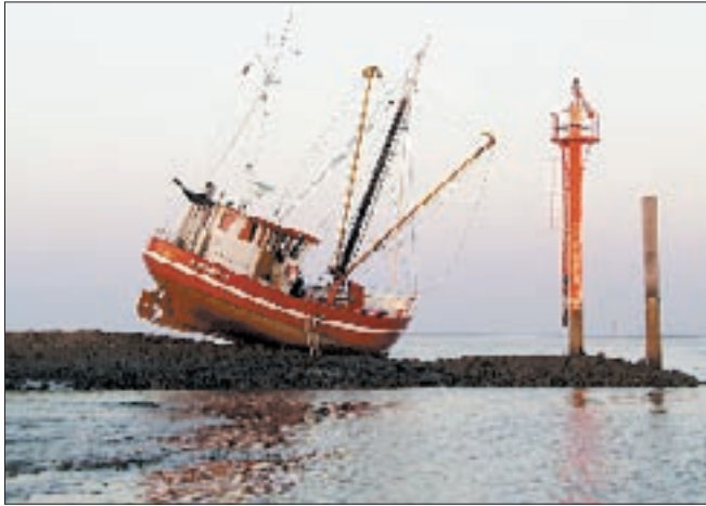
013wa Abb.: hb