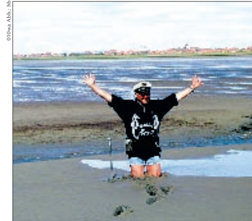
01Dwa Abb.: hb

Der Nordseeschlick, als heilendes Medium auch „Fango“ genannt, tut vor allem kranker Haut gut. An hartnäckigen Hautallergien, Ekzemen und Pilzkrankungen leidende Menschen reagieren zum Teil positiv auf den gubbeligen Stoff. Und wenn derselbe dann sogar noch liebevoll angerührt und so warm gemacht wird, dass man sich wie in einer Riesenplazenta in ihn versinken lassen kann, dann kommt er auch der Schönheit zugute – so zumindest steht's in der Reklame (die in einem Fall sogar darauf verweist, dass der verwendete Schlick speziell aus schadstofffreien 600 m Tiefe gefördert würde ...). Es gibt sie also offenbar doch, die Schadstoffe, und wir werden ihnen später noch ein paar Zeilen widmen müssen.