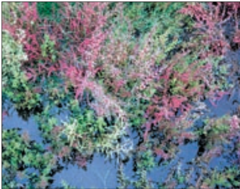
► Farbenfrohe Wattpflanze: Der (Watt)Queller

zen von Sinkstoffen und somit die Landbildung. In diese Verlandungszone dringen schon einige Landarten ein, z. B. Kleinschmetterlinge, die den Queller als Lebensgrundlage benötigen.