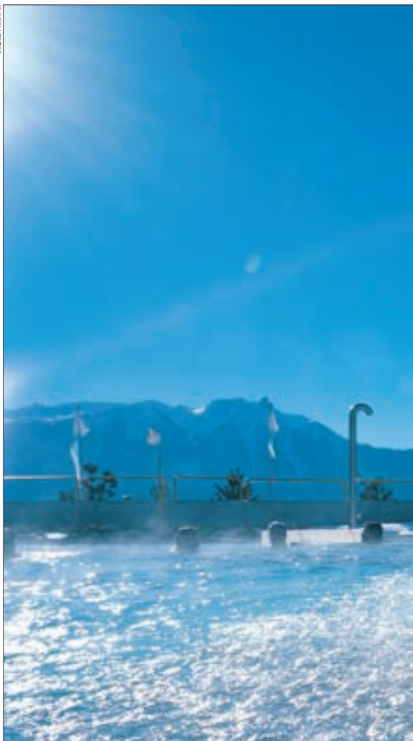
► Das Panorama von Ovronnaz im Schweizer Wallis