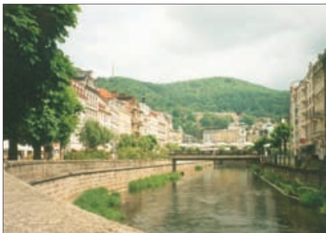
▲ Karlovy Vary (Karlsbad) – der größte Kurort Tschechiens

Von Bayern und von Mitteldeutschland sehr schnell zu erreichen, ist Tschechien schon immer ein für deutsche Gesundheitsurlauber beliebtes Zielgebiet gewesen. So richtig bekannt ist aber nur das so genannte böhmische Bäderdreieck mit den drei Ecken Karlovy Vary