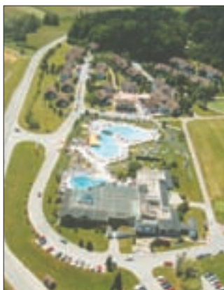
010kur Abb.: sl

Reguläre Buslinien nach Slowenien gibt es nicht. Die Bahnverbindung ist etwas umständ-