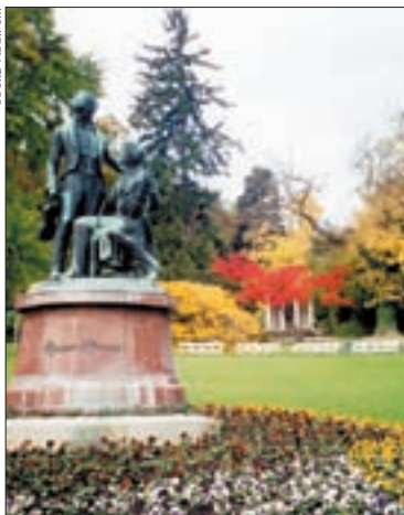
▲ Im Kurpark von Baden bei Wien

Das Niveau der medizinischen Betreuung ist gut bis sehr gut, der Personaleinsatz in den Kurmittelhäusern auffallend gut, der Service demzufolge oft besser als in Deutschland.