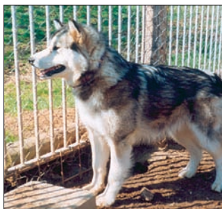
012mu Abb.: tg

Der Alaskan Malamute ist auch als die „Lokomotive des Nordens“ bekannt. Er bekam seinen Namen von den Malimiut, den Einwohnern der Kotzebue-Region in Alaska. Diese Hunde wurden gezüchtet, um schwere Lasten zu ziehen und raue Winter auszuhalten. Sie sind die Schwergewichte unter den Schlittenhunden. Sie zogen nicht nur Schlitten, sondern auch die großen Umiakboote entlang der Küste. (So ein Umiak konnte schon mal eine Tonne wiegen.) Malamutes