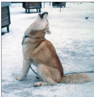
015 mu. Abb.: tg

Der Siberian Husky ist ein mittelgroßer, dynamischer Hund mit einem dichten Fell – Attribute, die ihn zu einem idealen Zughund für leichte Lasten auf langen Strecken machen. Diese Hunde werden seit Jahrtausenden gezüchtet und kamen im Zuge der Völkerwanderungen über die Beringstraße auch nach Alaska. Die Hunde wurden immer wieder mit anderen nordischen Hunden gekreuzt, um die Leistungsfähigkeit zu erhalten oder gar zu verbessern. Auch Wolfseinkreuzungen werden immer wieder berichtet und kontrovers diskutiert. Diese Rasse wird seit etwa 70 Jahren auch nach Rassestandards gezüchtet.