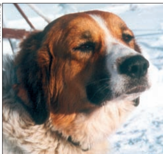
▲ Tschechischer Berghund

Das Problem dieser Hunde im Vergleich zum Alaskan oder Siberian Husky liegt in der Pfotenqualität, der Fellqualität, der Widerstandsfähigkeit im rauen Winterwetter und im Futterverbrauch. Trotzdem soll dies Besitzer von geeigneten Hunden nicht davon