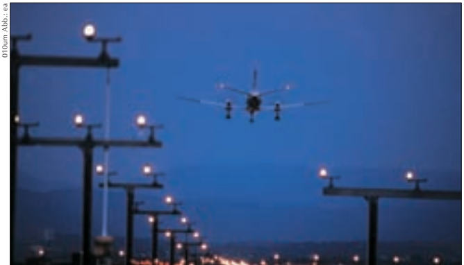
010um Abb.: ea

▼ Wer erst spät abreist, sollte frühzeitig fragen, ob das Zimmer länger genutzt werden kann