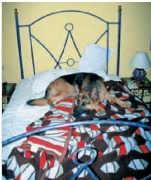
011um Abb.: mh

Es gibt zwar heutzutage in vielen Ländern spezielle Hotels für Hunde, Katzen und/oder andere Haustiere, aber nicht jeder Beherbergungsbetrieb für Menschen erlaubt die Haltung von Vierbeinern in den Schlafzimmern. Es gibt Häuser, die sich strikt weigern, jegliche Art von Tieren zu beherbergen. Dann gibt es solche, die es widerwillig tun, dafür aber einen Zuschlag verlangen. Aber es gibt auch Hotels, die damit Werbung machen, auch für Vierbeiner den gleichen Service zu bieten wie für ihr Herrchen oder Frauchen – und dies sogar kostenlos. Auf jeden Fall sollte man sich unbedingt vorher erkundigen, ob die haarigen Familienmitglieder willkommen sind oder nicht.