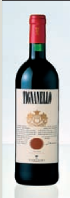
004wv Abb.: an

Sie begannen, Sangiovese mit den neuen französischen Rebsorten zu vermischen, traten teilweise auch mit sortenreinen Weinen an. Und sie bauten ihre Weine nach dem Vorbild in Bordeaux in kleinen Eichenholzfässern („barriques“) aus. Diesen Winzern blieb zunächst nichts anderes übrig, als ihre Super-Weine deklassiert als Tafelweine anzubieten. Doch dieses „Understatement“ hat den Weinen nur genützt. Längst hat sich auch der italienische Gesetzgeber den neuen Realitäten gebeugt – heute können sich die Spitzen-Weine der Toskana der neuen Qualitätsbezeichnung IGT (Weine mit typischer Herkunftsbezeichnung) bedienen, wenn sie nicht ohnehin schon unter der Spitzenklassifizierung DOCG als Weine mit kontrollierter und garantierter Herkunftsbezeichnung in den Markt gebracht werden.