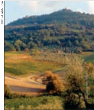
▲ Im Weinbaugebiet von Montalcino, im Süden der Toskana

Die Toskana ist eine mittellitalienische Region mit einer Gesamtfläche von annähernd 30.000 Quadratkilometern und gut dreieinhalb Millionen Einwohnern. Sie besteht aus den Provinzen Arezzo (AR), Florenz (FI), Grosseto (GR), Livorno (LI), Lucca (LU), Massa-Carrara (MA), Pisa (PI), Pistoia (PT) und Siena (SI) mit Florenz als Hauptstadt – in allen Provinzen wird Weinbau betrieben. Die Rebfläche nimmt an die 70.000 Hektar ein, die Erntemenge beträgt knapp 3 Millionen Hektoliter. Damit hat die Toskana weit über 5 % Anteil an der italienischen Gesamtrebfläche, produziert aber weit weniger als 5 % der italienischen Weinmenge – alleine schon an diesem Beispiel der Begrenzung der Erntemenge zeigt sich die neue Qualitätsorientierung der toskanischen Winzer!