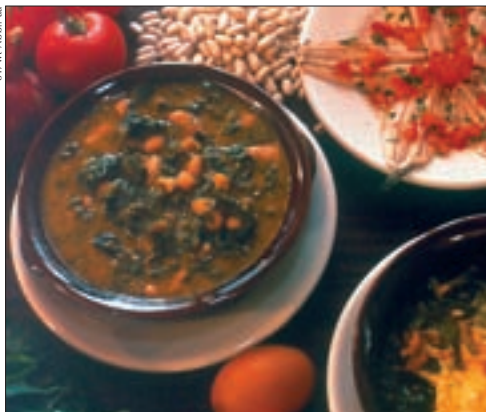
◀ Ribollito, toskanische Suppe