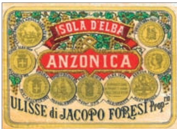
▲ Historisches Weinetikett aus Elba

gar nicht in das neue Qualitätsbestimmungssystem in Italien passten. Dies bestand bis in die 60er Jahre des vorigen Jahrhunderts zunächst aus kontrollierten Herkunftsbezeichnungen, die zwar mehr Disziplin im italienischen Weinbau herbeiführten und für das Bewusstsein für Modernisierungen bei den Winzern sorgten, doch passten diese innovativen neuen Weine nicht in das althergebrachte Schema und mussten daher als Tafelweine angeboten werden – ihre Qualität sprengte alle Grenzen und sie traten als „Super-Toskaner“ in die Weinwelt ein. Interessant an der Entwicklung war, dass die neuen Qualitätsimpulse in der Toskana zunächst nur von wenigen alteingesessenen Winzern ausgingen, denn gerade hier hatte die Landflucht im Weinbau deutliche Lücken hinterlassen, aber dann engagierten sich um so mehr produktfremde Investoren aus den italienischen Städten und vor allem auch aus dem Ausland in den toskanischen Weingärten. Vor dem Hintergrund der toskanischen Kulturtradition