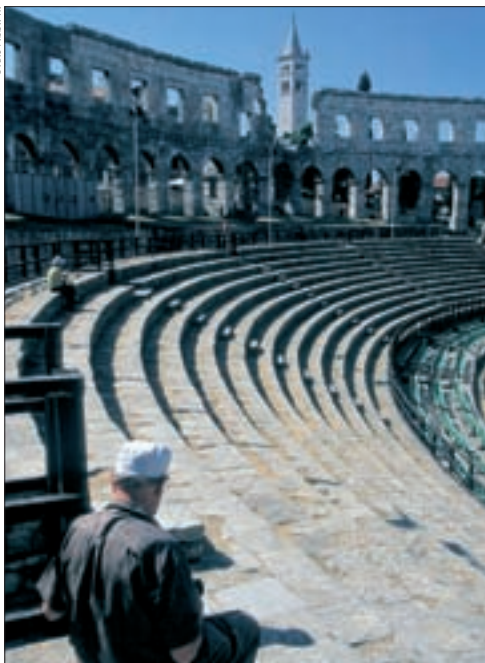
◀ In der römischen Arena von Pula