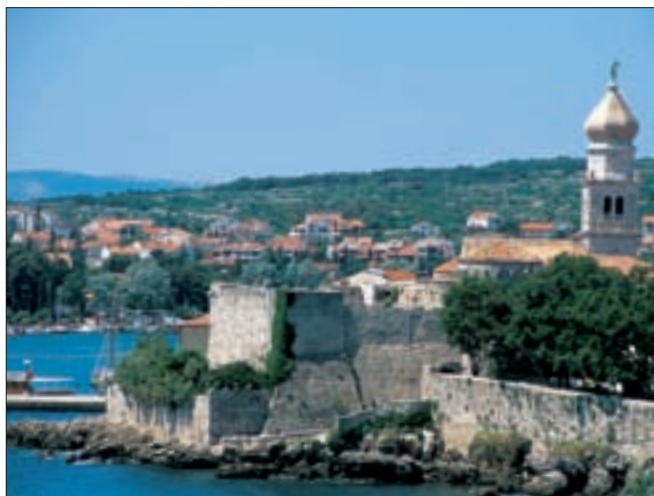
01616 Abb.: ik

Baška im Südosten ist der touristische Hauptort mit einer Kette von Hotels an der weiten Sand-/Kiesbucht, auf deren Landspitze das alte Baška mit steinernen Fischerhäuschen und vielen Kneipen und Restaurants steht. Im Osten der Insel kann man in und um Vrbnik einen der besten Weißweine des Kvarner, den Zlata Žlahtina , verkosten und kaufen. Und ganz im Norden, kurz vor der Brücke, die Krk mit dem Festland verbindet, liegt das malerische alte Städtchen Omišalj .