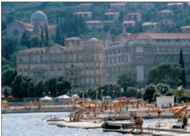
0146 Abb.: FK