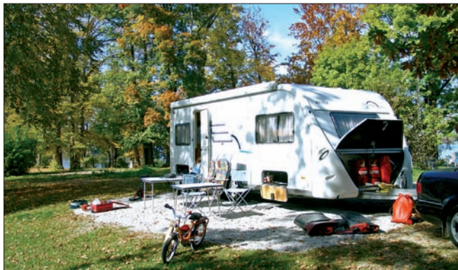
03.3ww Abb.: miz