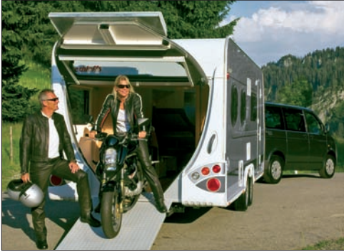
◀ Wohnwagen mit Heckklappe für Motorradtransport

Möglichkeit von außen zugänglichen Staukästen . Sperrige Surfbretter, Snowboards oder Skier passen meist noch in die Staufächer unter der Sitzbank oder unter dem Bett.