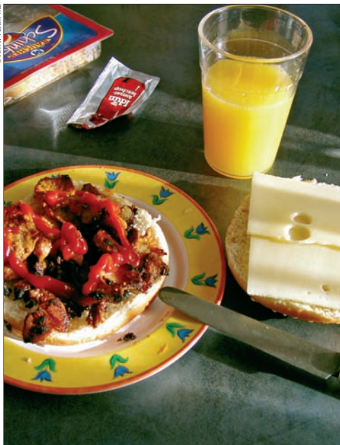
◀ Typisches Camperessen: Cheeseburger

Bei der Anordnung der Küche gibt es zwei Möglichkeiten mit jeweiligen Vor- und Nachteilen: Ist die Küche auf der rechten Seite angeordnet, die auch immer die Türseite ist, bekommt der Koch das Geschehen vor dem Wohnwagen durch das Küchenfenster gut mit. Zudem kann das Essen einfach herausgereicht werden. Der Nachteil hierbei, insbesondere bei der Verwendung eines Vorzelts: Die Essensgerüche gehen bei offenem Fenster direkt ins Vorzelt und der Kühlschrank kühlt oftmals schlechter, da die rechte Seite meist die warme Südseite ist. Wenn die Küche in Fahrtrichtung links eingebaut ist, liegen die Vor- und Nachteile entsprechend anders herum.