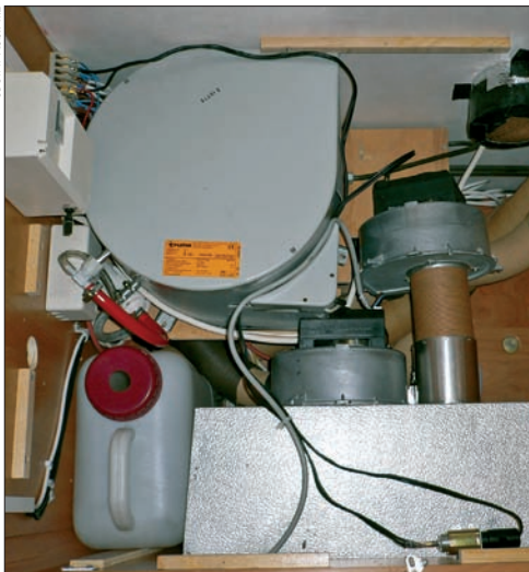
◀ Gaswasserboiler zur Warmwassererzeugung