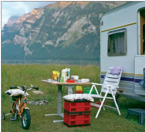
◀ Caravanning mit improvisierter Sitzgruppe

Es gibt noch einen anderen Grund, dies zu tun, nämlich wenn den Camper abends eine Mückenplage heimsucht. Ein Wohnwagen kann diese Insekten normalerweise fernhalten. Alle zu öffnenden Fenster sind in der Regel mit Mückengazens ausge-