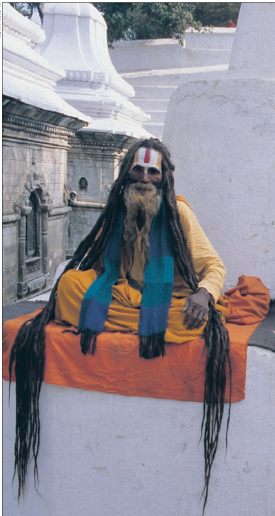
► Guru und Schüler am Pashupatinath-Tempel in Kathmandu