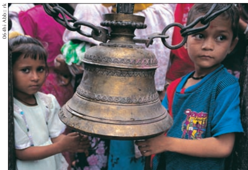
06-4hr Abb:: rk

► Glocken, mit den die Götter von den Besuchern erweckt werden, gibt es in jedem Tempel