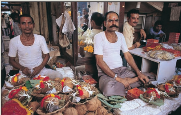
12.661 Abb.: rk

Nebenbei gilt die Kokosnuss als eine Art Fruchtbarkeits-symbol, das sowohl Nahrung als auch Flüssigkeit spendet. Traditionell werden Schiffe durch das Aufschlagen einer Kokosnuss getauft, so wie im Westen dafür eine Flasche Champagner „geopfert“ wird. Nicht aufgeschlagen werden dürfen Kokosnüsse in Anwesenheit einer schwangeren Frau, da angenommen wird, dasselbe könnte mit dem Kopf des ungeborenen Kindes geschehen.