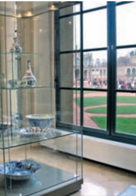
032dr

Kurfürst August der Starke sammelte auch Zeugnisse der Waffenschmiedekunst, andere schenkten europäische und orientalische Herrscher. Auffallend ist eine Gruppe von Kinderharnischen, weitere Glanzstücke sind drei sächsische Kurschwerter und der Prunkharnisch für Mann und Ross, den der Antwerpener Goldschmied Eliseus Libaerts Mitte des 16. Jahrhunderts für den schwedischen König Erik XIV. anfertigte.