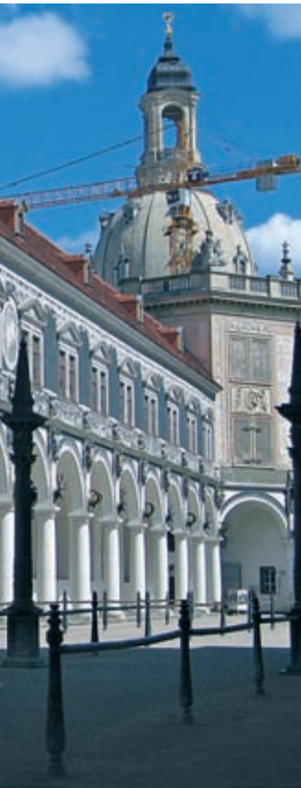
03:44r Abb.: gfk

August III., der 1918 abdankte, fehlt. Er war zur Zeit der Entstehung des Fürstenzuges noch ein Kind.