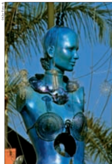
Kunst am Clarke Quay

Das muntere Treiben von Boat Quay ist auf die dahinter gelegene Circular Road übergeschwappt, auch hier haben sich zahlreiche Restaurants und Bars angesiedelt. Diese sind oft günstiger als die direkt am Boat Quay befindlichen. Die an Boat Quay gelegenen MRT-Stationen sind City Hall, Raffles Place und Clarke Quay, von denen man bequem zu Fuß weiterkommt.