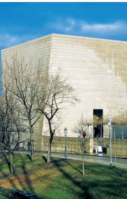
042gr Abb.: BfK

☉51 [I D9] Wettiner Keller , An der Frauenkirche 5, Tel. 0351 8642860, Di. – Sa. 18–23 Uhr, Haltestelle: Altmarkt. Beliebter Weinkeller (zum Hilton gehörig) mit regionalen Spezialitäten und sächsischsprachiger Karte: „Werde Gäse, kehrn’s e ein zu nem Glässchen sächsischem Wein, gemietlich hier bei Gerschein.“ Im Kellergewölbe der Brühlschen Terrasse, Hauptgerichte 9–20 €.