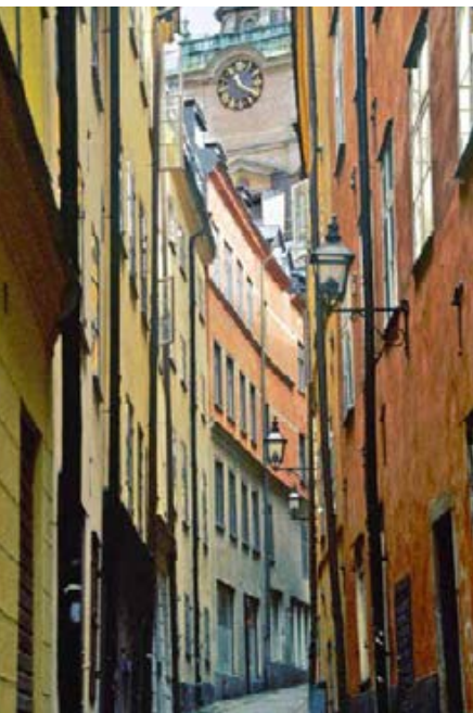
051st Abb.: sk