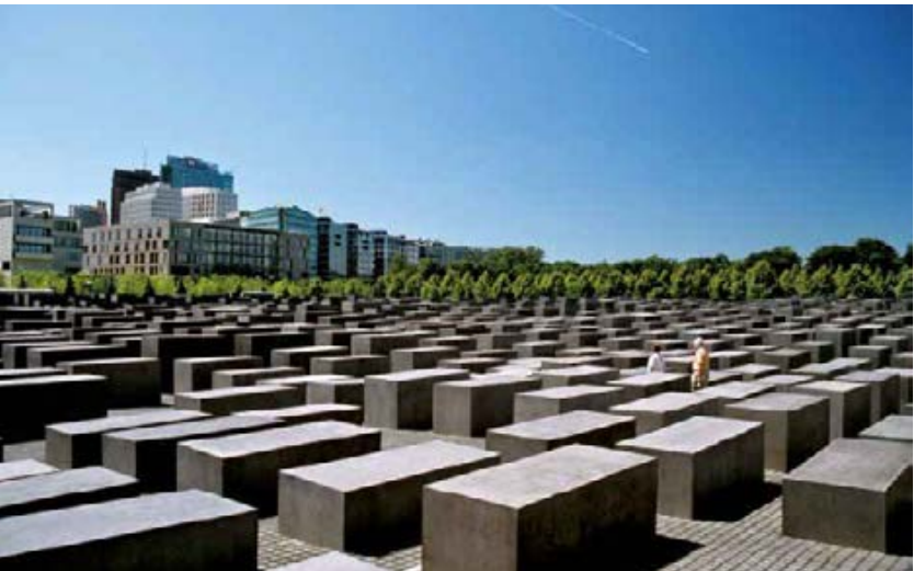
042be Abb.: Kj

Ort der Information der Herkunft, dem Leben und dem Schicksal der Opfer. Um die unfassbare Anzahl von sechs Millionen ermordeten Menschen in den Bereich des Vorstellbaren zu rücken, werden im „Raum der Dimensionen“ mithilfe eines umlaufenden Bands die jüdischen Opferzahlen aller Länder Europas zum Ausdruck gebracht. Der „Raum der Familien“ zeichnet 15 jüdische Familienschicksale nach. Der „Raum der Orte“ führt den Betrachter anhand historischer Filmdokumente und Fotografien zu über 200 Vernichtungsstätten des NS-Terrors – Gettos, Konzentrations- und Vernichtungslager –, während im „Raum der Namen“ Kurzbiografien der Opfer verlesen und zeitgleich ihre Namen und Lebensdaten an die Wand projiziert werden. Könnte an alle sechs Millionen Holocaust-Opfer in dieser Weise erinnert werden, würde die Lesung sechs Jahre, sie-