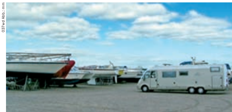
◀ Wohnmobilstellplatz in Aabenraa

6200 Aabenraa, H. P. Hanssens Gade 5, Postboks 115, Tel. +45 74623500, Fax +45 74630744, in- fo@visitaabenraa.dk, www.visitaabenraa.dk, Mo–Fr 9–16 Uhr, Sa 9–12 Uhr, in der Hauptsaison Mo–Fr 9–17.30 Uhr, Sa 9–13 Uhr.