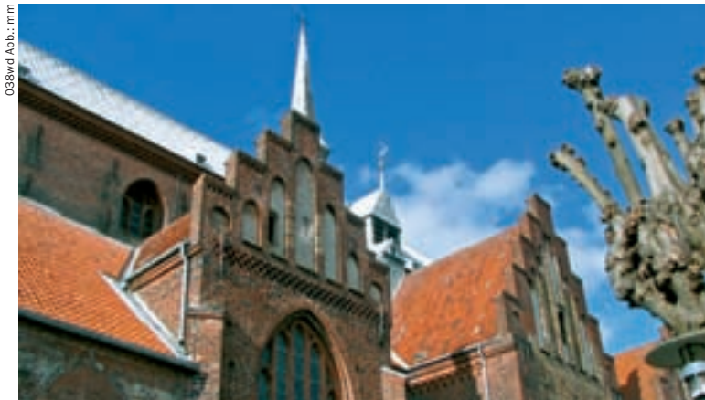
038wd Abb.: mm

Kleiner Platz zwischen Hauptstraße und Wald. Lage/Anfahrt: direkt an der Straße 170 von Aabenraa nach Haderslev, kurz vor Genner auf der rechten Seite; Platzanzahl: 50; Untergrund: Wiese; fest; Ver-/Entsorgung: Strom, Trinkwasser, Abwasser, Chemie-WC; Sicherheit: umzäunt; Preis: 45 DKK pro Person (6,25 €), 25 DKK/Strom (3,50 €); Geöffnet: ganzjährig; Kontakt: 6200 Aabenraa, Haderslevvej 462-464; Tel. +45 74698927, gennerhoel@yahoo.dk, www.gennerhoel.dk.