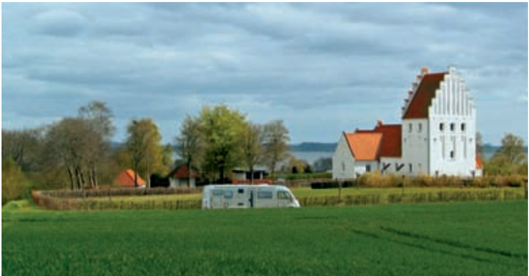
0633wd Abb.: mm

Wer sein Fahrrad nicht dabei hat oder sich nicht zu einer Radtour entschließen möchte, der hat in Kruså die Möglichkeit, ein ehema-