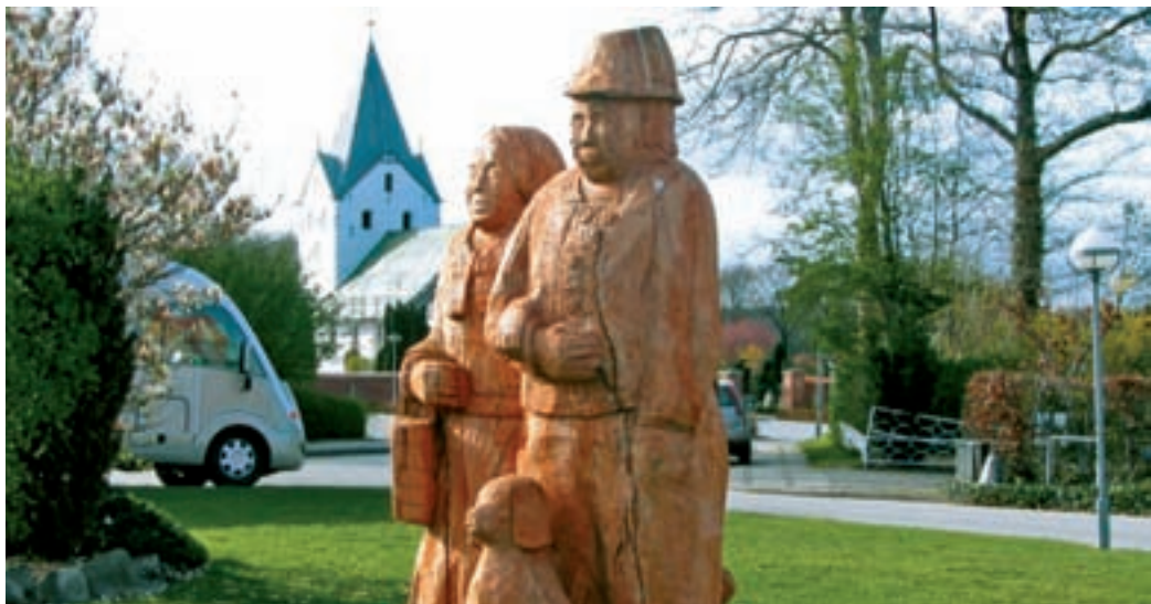
0639wd Abb.: mm

▼ In Dänemark findet man häufig Holzschnitzereien