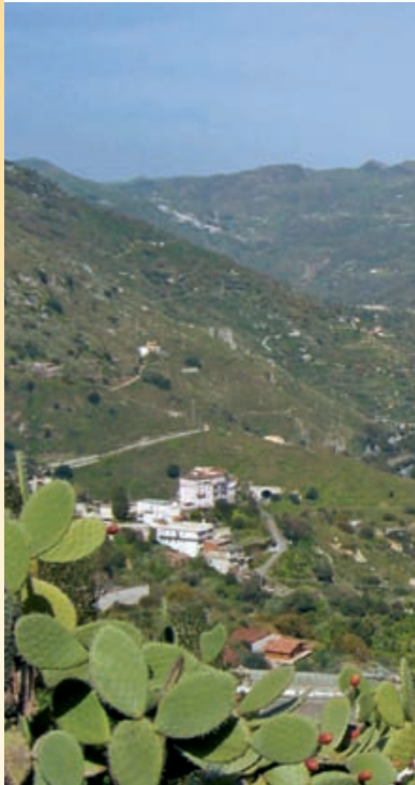
135ws Abb.: gg